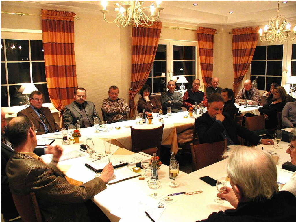
Die Versammlung fand im Gasthof „Koch“ in Rixbeck statt